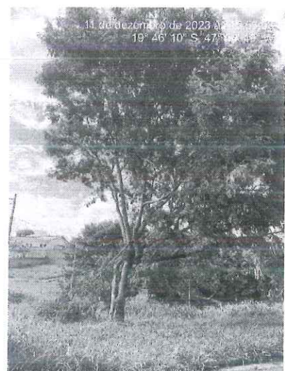
Figura 3: Leucena alocada no cruzamento da Pç Lago Azul com a Al. Mariana Rosa de Jesus.