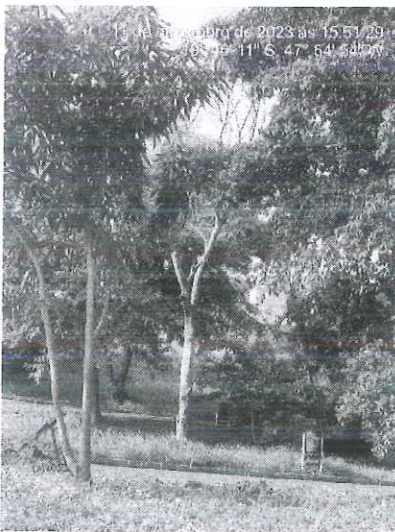
Figura 1: Espécime morto próximo ao cruzamento da Pç. Lago Azul com a Al. Euripedes de Paula Soares.

Diante disso, tratando-se de área pública, estes Técnicos recomendam o desmonte das 02 (duas) árvores mortas e poda de elevação de copa nos demais indivíduos arbóreos. Para tanto, encaminhamos a presente solicitação para a Secretaria de Serviços Urbanos e Obras (SESURB) para conhecimento e execução.