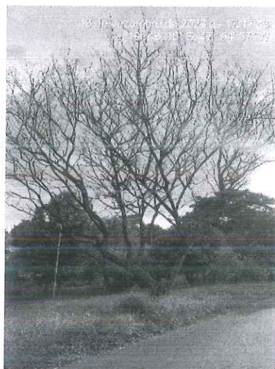
Figura 2: Espécime morto defronte ao imóvel nº 1366.